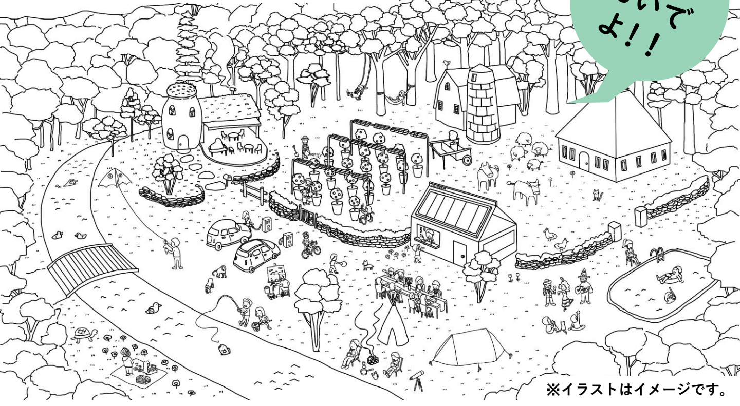
※イラストはイメージです。